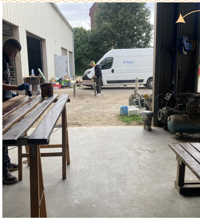
Aide à l'entretien du mobilier urbain aux services techniques