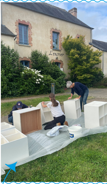
Création d'un nouveau mobilier pour la médiathèque