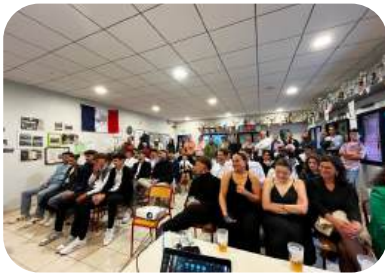
Un public digne du festival de Cannes

La gazette est l'occasion de vous révéler le palmarès complet de la cérémonie.