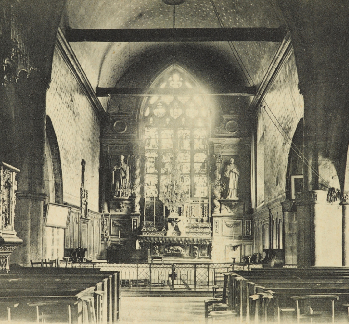
20. - ROMILLÉ (I.-et-V.). - L'Intérieur de l'Eglise